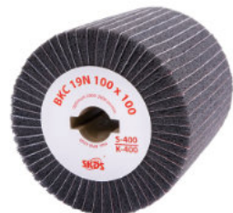
Typ: BKC 19N