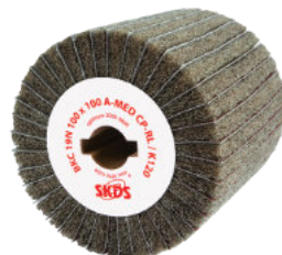
Typ: BKC 19N

Impregnační získá brusné rouno mnohem větší životnost.