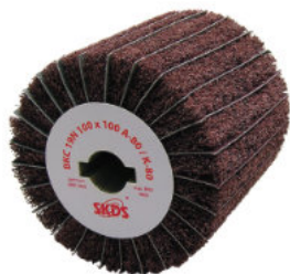
Typ: BKC 19N